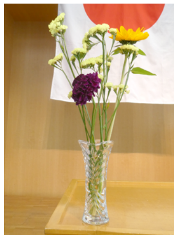
スターチス(前島憲司会長) ヒマワリ(畑中雄太君) スカビオサ(山本晃久君)