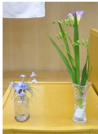
フリージア (畑中雄太君) イフェイオン (建部卓也君)