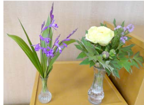
スターチス (畑中雄太君) シラン (建部卓也君) ボタン (小島久美子君)