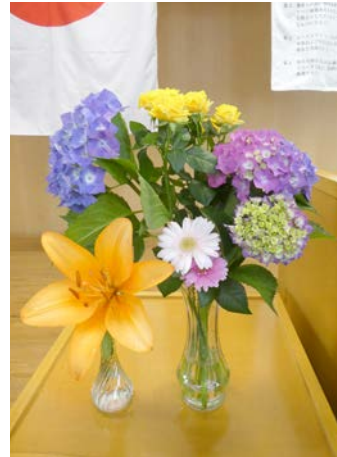
ガーベラ (和田勝美会長) 紫陽花 (滝澤 勇君) スプレーバラ (畑中雄太君) スカシユリ (建部卓也君)