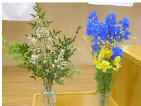
スプレーデルフィニウム (和田勝美会長) アルストロメリア (畑中雄太君) 南天 (建部卓也君)